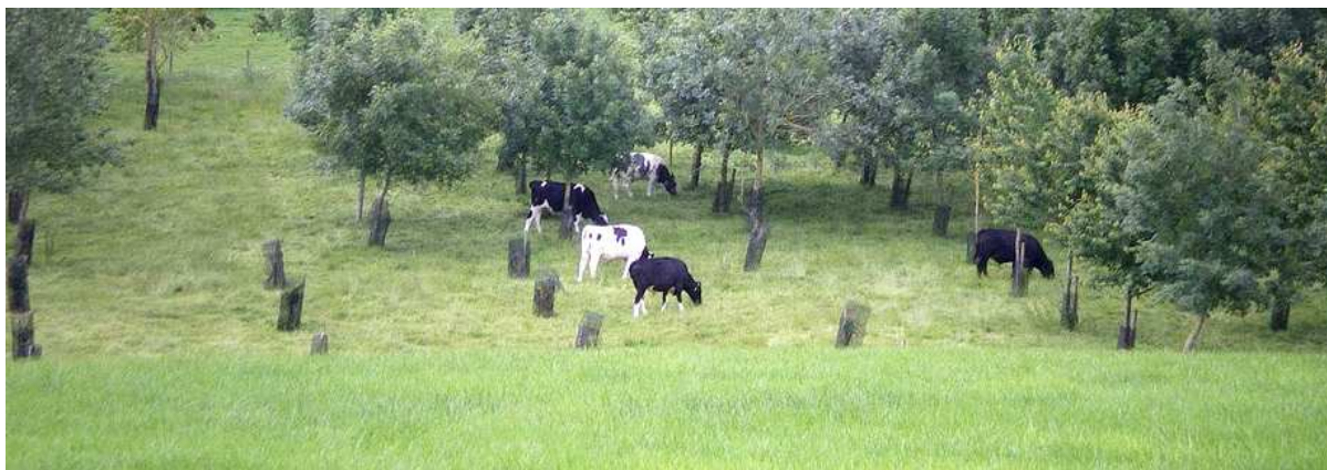
Figuur 3. Een potentieel silvo-landbouw systeem dat in Nederland kan worden geadopteerd en aangepast.