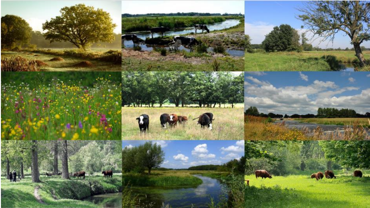
Impressie natuurinclusieve zone